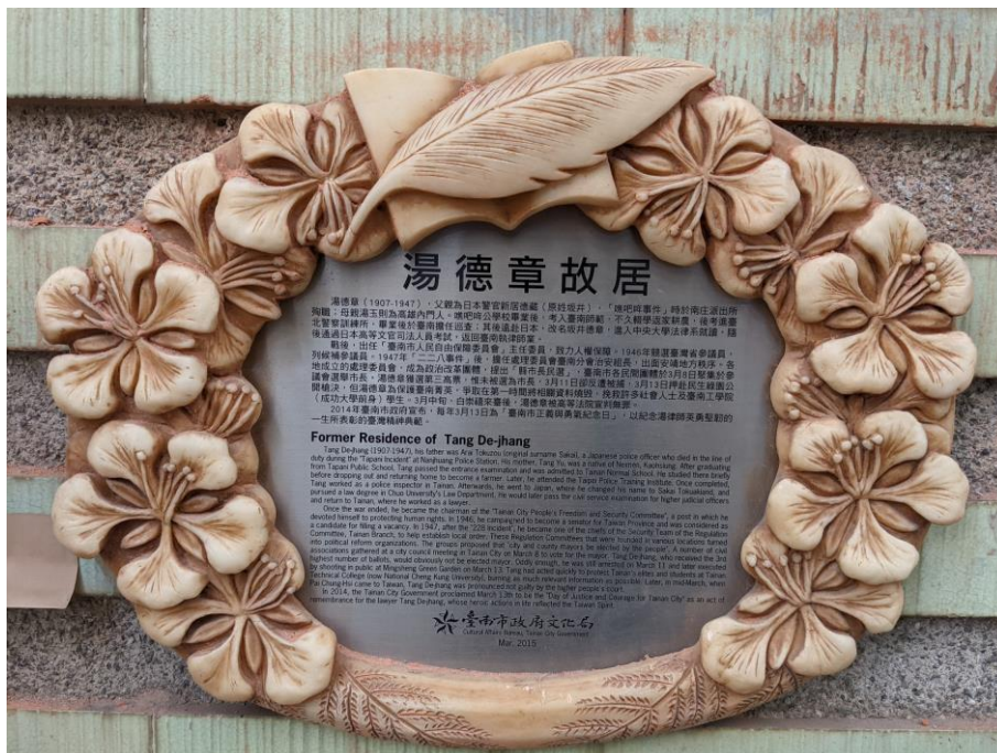
▲湯德章故居前說明牌，述說湯德章生平和英勇事蹟。