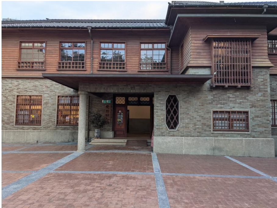
▼湯德章曾短暫擔任第一任臺南南區區長，當時的區公所現為臺南愛國婦人會館。